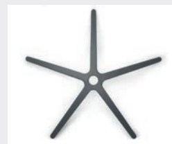
FHKEG Kunststoff eisengrau (Option) Plastic iron grey (option)