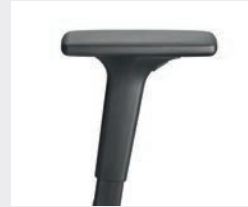
A441KGS (4F) Armauflagen PU soft Armpads PU soft