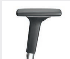
A541APO (5F) Armauflagen PU soft Armpads PU soft