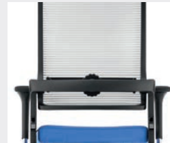
Schwarz (RAL 9011) Black (RAL 9011)