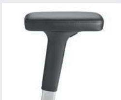
A442APO (4F) Leder-Armauflagen Leather armrests