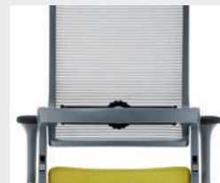
Eisengrau (RAL 7011) Iron grey (RAL 7011)