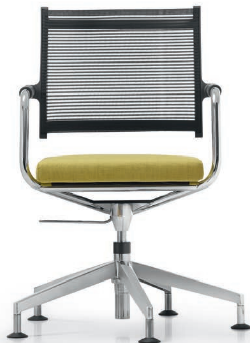
LO 3307 Armauffagen (PA) | Armpads (PA) AA01KGS