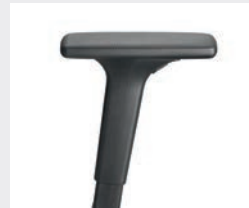
A441KGS (4F) Armauflagen PU soft Armrests PU soft