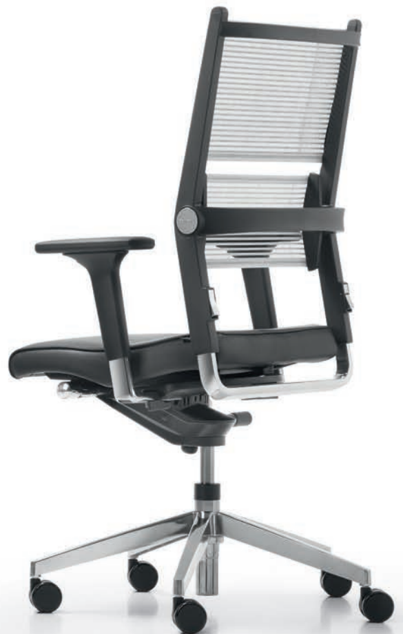
SD LO 3380 + Armlehnen | Armrests A441APO