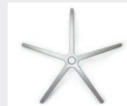
FHAPO Aluminium poliert (Option) Aluminium polished (option)