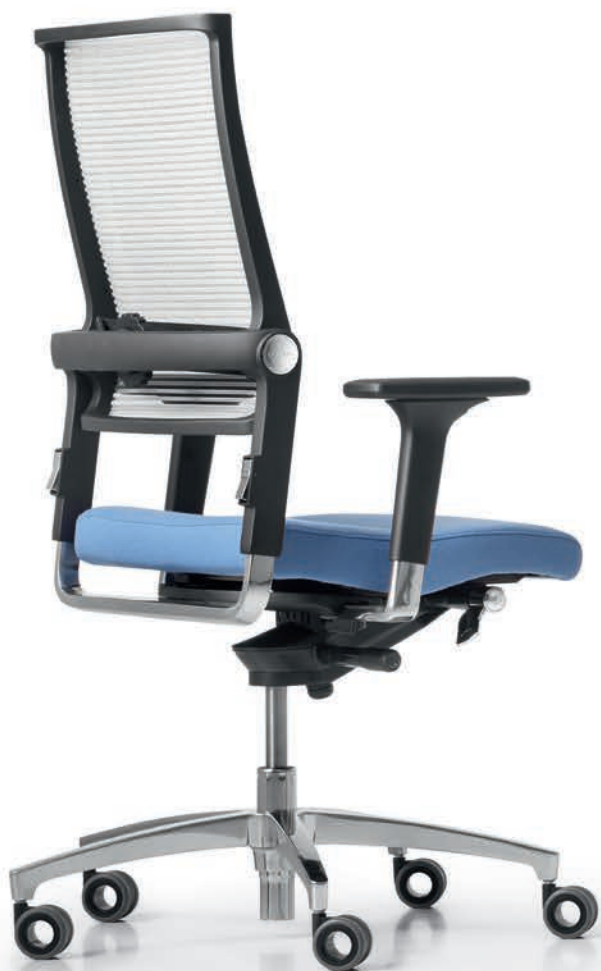
SD LO 3010 + Armlehnen | Armrests A441APO