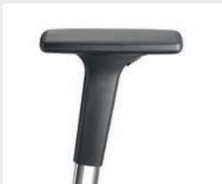
A441APO (4F) Armauflagen PU soft Armpads PU soft