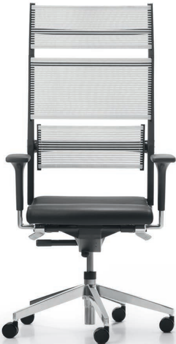
SD LO 3390 + Armlehnen | Armrests A441APO

The elegant seating solution for the executive floor. A great thing to look at – even better to sit on: the Lordo executive swivel chairs come equipped with our patented Syncro-Dynamic Advanced® mechanism, guaranteeing comfortable and constant body support. Both seat and backrest follow the user's natural way of movement, including keeping one's legs in a comfortable position at all times.