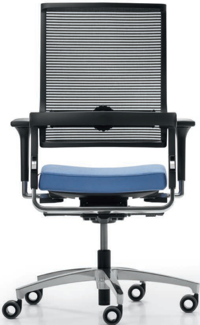
QS LO 3017 + Armlehnen | Armrests A441APO

No matter if you pick a model with or without a neckrest, our Lordo swivel chairs with Syncro-Quickshift® mechanism adapt to the user's natural movement – in perfect harmony. The three-position seat-tilt and seat-depth adjustment combined with four-position synchronised movement enable a healthy and fully ergonomic way of working.