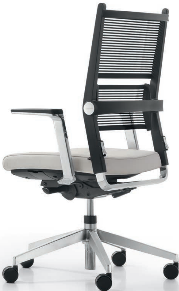
AS LO 3360 + Armlehnen | Armrests AS06APO

Visitor and conference chairs perfectly complete the Lordo product range. Their modern design and fully flexible mesh fabric backrest will be a true asset to both your guests and colleagues. There are a lot of functional options to pick from: The cantilever chairs are stackable, and the height-adjustable conference chairs are available with either gliders or castors.