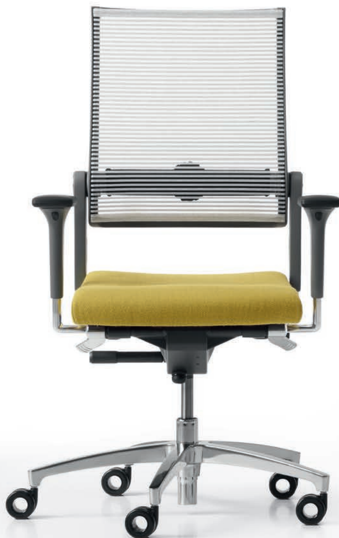
SD LO 3010 + Armlehnen | Armrests A441APO