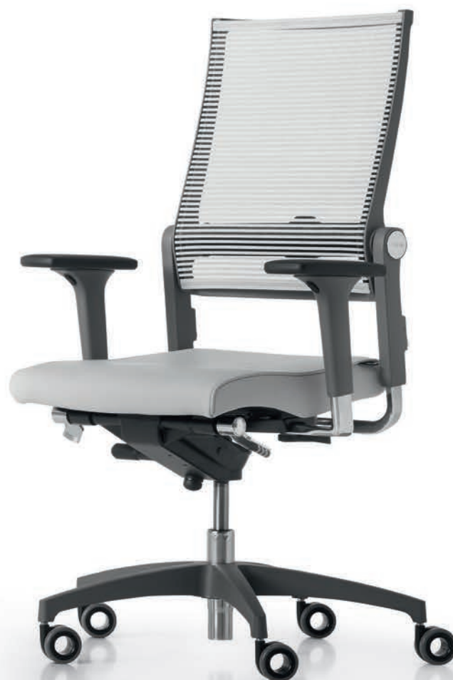
SD LO 3010 + Armlehnen | Armrests A441APO