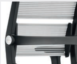
Lordosenstütze, pendelnd gelagert Lumbar support, swing-mounted