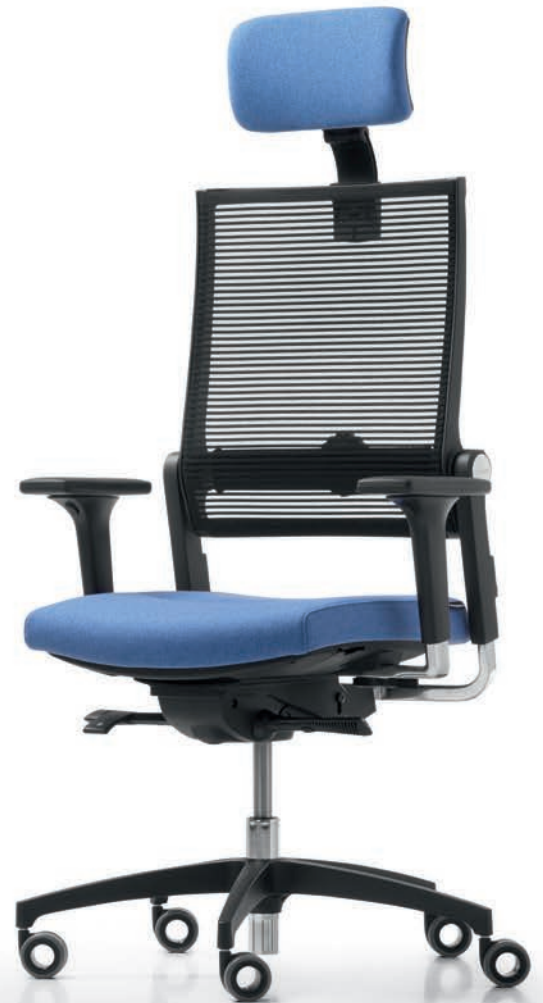
QS LO 3027 + Armlehnen | Armrests A441APO