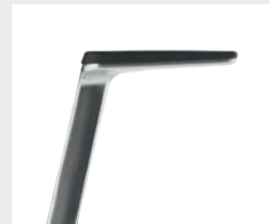
AS06APO Armauflagen PU soft Armpads PU soft

*mit antibakterieller Mikrosilberausrüstung zum Schutz vor Infektionen with antibacterial microsilver finish to help prevent infections