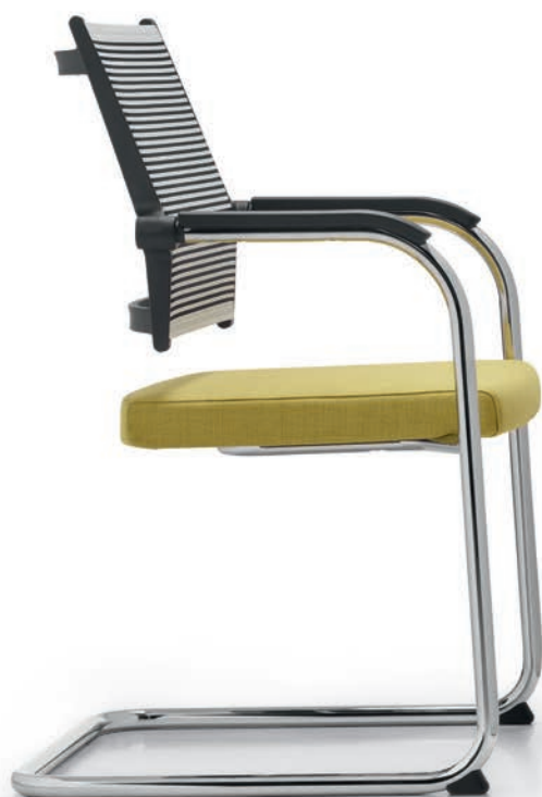
LO 3315 Armauffagen (PU) | Armpads (PU) AA03KGS