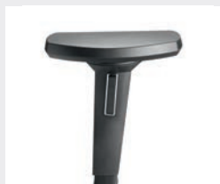
A618KGS (6F; NPR) Armauflagen PU soft Armrests PU soft

Farbe der Armlehnenhülse = Modellfarbe Colour of armrest cover = model colour