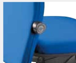
Lumbalstütze (L01): mechanisch 3,5 cm tiefenverstellbar. Lumbar support (L01): mechanically depth-adjustable (3.5 cm).