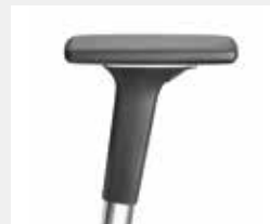
A541APO (5F) Armauflagen PU soft Armpads PU soft

*mit antibakterieller Mikrosilberausrüstung zum Schutz vor Infektionen with antibacterial microsilver finish to help prevent infections