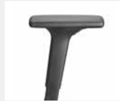
A341KGS / A348KGS* (3F) Armauflagen PU soft Armpads PU soft